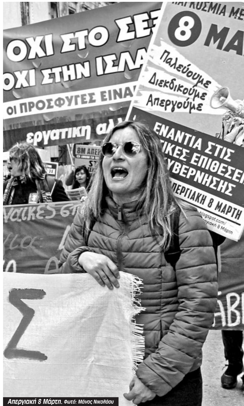
Απεργιακή 8 Μάρτη.

Ο σεξισμός και οι γυναικοκτονίες ο όρος που δεν αναγνωρίζει η κυβέρνηση και που δίνει το πάτημα σε κάθε αστυνομικό να αδιαφορεί ακόμα και αν συμβαίνει στο 1,5 μέτρο