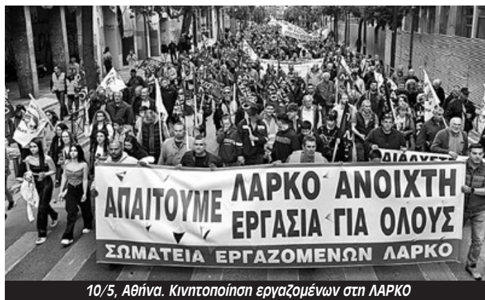
10/5, Αθήνα. Κινητοποίηση εργαζομένων στη ΛΑΡΚΟ