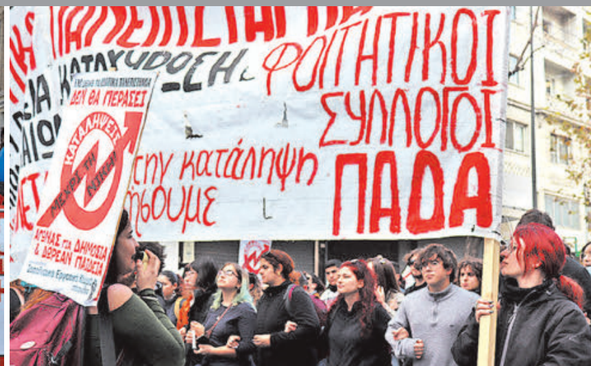
Οι κοινοί αγώνες των εκπαιδευτικών και της νεολαίας είναι η απάντηση. Φωτό από το πανελλαδικό συλλαλητήριο καταλήψεων με συμμετοχή εκπαιδευτικών στις 8/2/2024

Τ ο Υπουργείο Παιδείας δημοσίευσε πρόσφατα μια σειρά από «δραστικά» μέτρα για την αντιμετώπιση της βίας ανηλίκων και του σχολικού εκφοβισμού που όχι απλά αποτελούν παιδαγωγικές προσεγγίσεις παλαιότερων δεκαετιών, αλλά δεν πρόκειται σε καμία περίπτωση να λύσουν το ζήτημα της βίας, καθώς είναι τα ίδια κομμάτι του προβλήματος. Η βία ανηλίκων είναι πράγματι ένα ανησυχητικό φαινόμενο εντός και εκτός σχολείων. Η Πανελλήνια Έρευνα του ΕΠΙΨΥ (2022) αναφέρει ότι σχεδόν 1 στους 3 (30,7%) εφήβους στην Ελλάδα έχει πρόσφατα εμπλακεί σε βίαιο καυγά, ενώ 1 στους 8 (12,1%) εφήβους στην Ελλάδα έχει πολύ πρόσφατα συμμετάσχει σε εκφοβισμό άλλου/ης μαθητή/ριας και σε ποσοστό 7,1% έχει κάνει ηλεκτρονικό εκφοβισμό. Αλλά γιατί εκπλησσόμαστε για την ύπαρξη βίας σε μια ολόκληρη και πιο βίαιη κοινωνία; Και πώς μπορούμε να την αντιμετωπίσουμε ουσιαστικά;