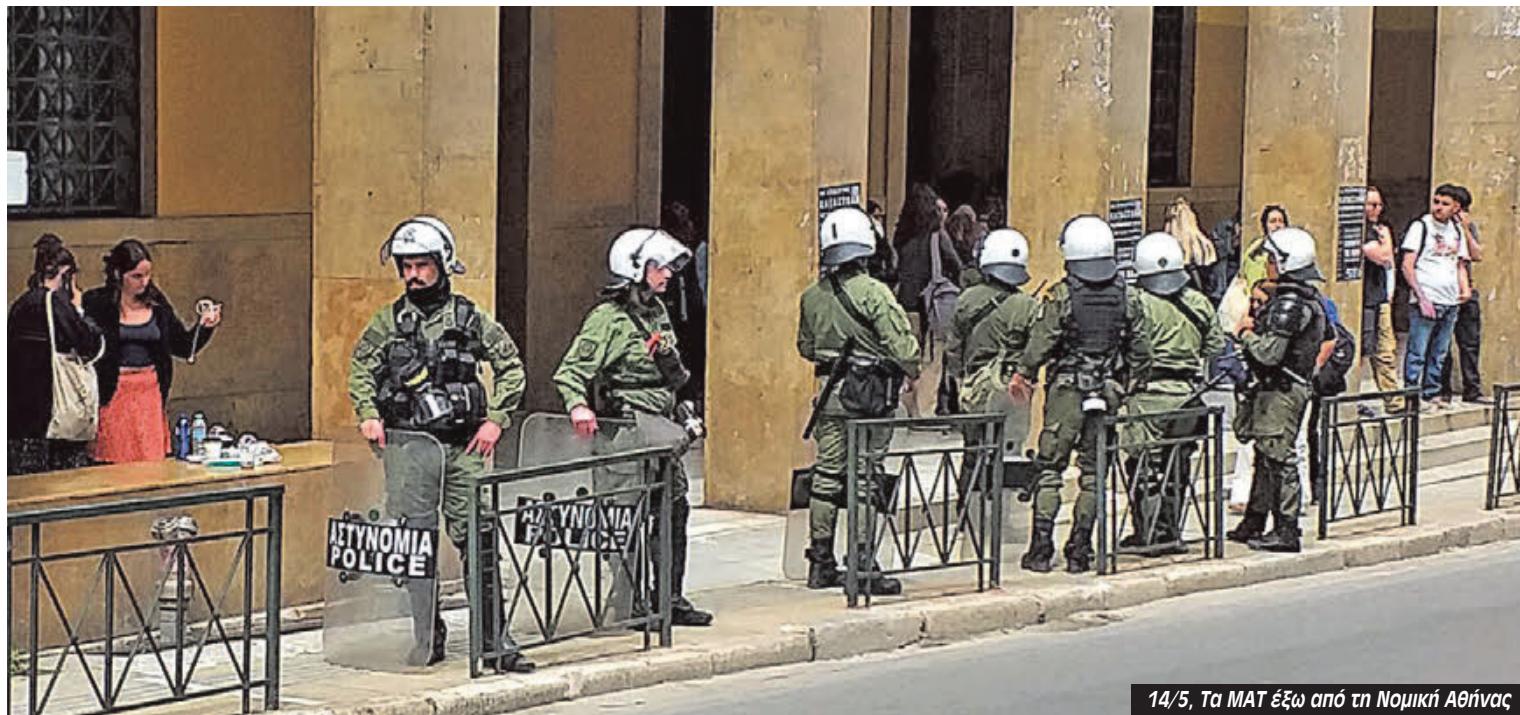
14/5, Τα MAT έξω από τη Νομική Αθήνας