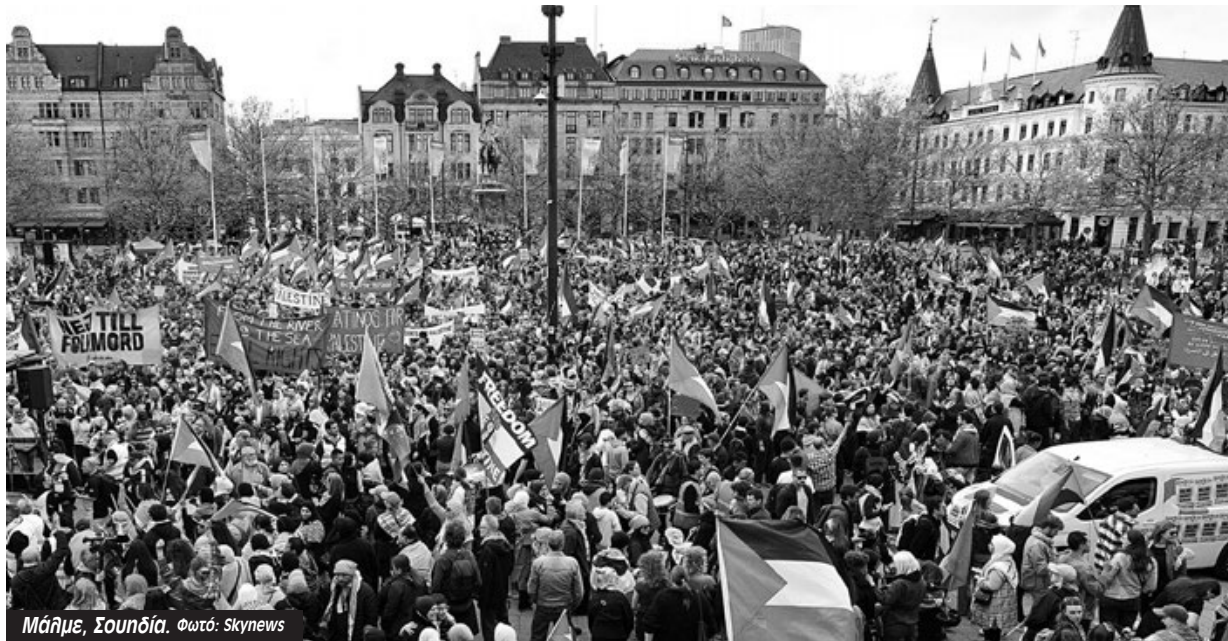
Μάλμε, Σουηδία.

πλατιά την χορηγία της ισραηλινής εταιρίας Morrocan Oil με το κράτος του Ισραήλ και τον ίδιο τον Νετανιάχου να επενδύουν τα ρέσα τους στο διαγωνισμό για να βγουν από την απομόνωση στην οποία έχουν περιέλθει. Σε βιντεοσκοπημένο μήνυμά του πριν από τον τελικό, ο Νετανιάχου δήλωσε ότι η Γκολάν (που εκπροσωπούσε το Ισραήλ, «περήφανη για τη χώρα της ιδιαίτερα αυτή τη χρονιά» όπως δήλωσε) έχει την πλήρη υποστήριξη της κυβέρνησης. Και πράγματι την είχε. Όπως ομολογείται στους Times of Israel, «η αλήθεια είναι ότι φέτος υπήρξε προφανώς μια οργανωμένη, επίμονη προσπάθεια από τους υποστηρικτές του Ισραήλ».